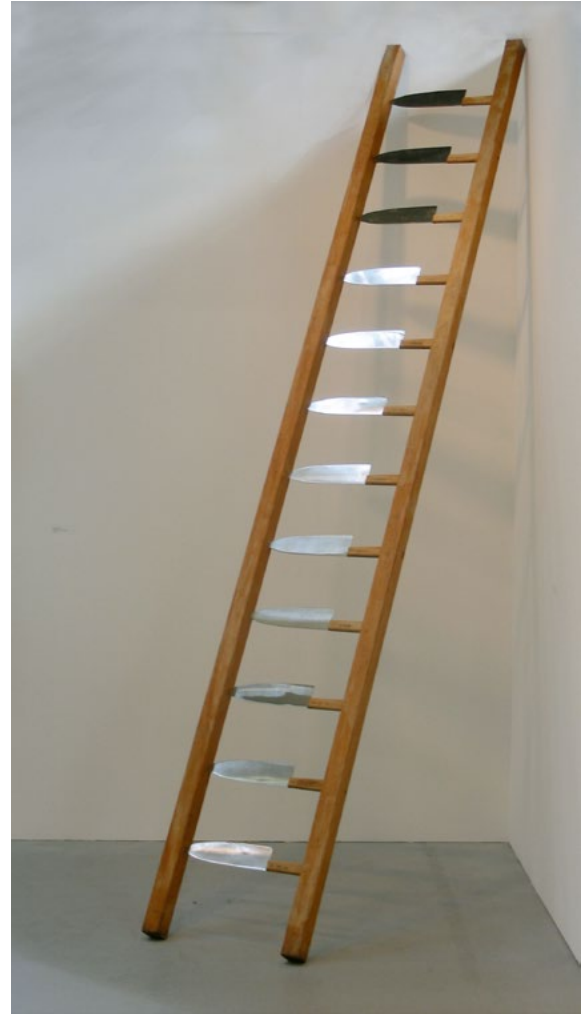
Marina Abramović, Rhythm 0 Performance Studio Morra, Neapel, 1974