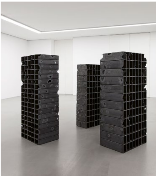
Mona Hatoum, Bourj A, 2011, Bourj II, 2011 und Bourj III, 2011 Courtesy of Mona Hatoum Foundation, © Mona Hatoum. Ausstellungsansicht MdbK Leipzig, Foto: dotgain.info

Eine Ausstellung in Kooperation mit der Kunsthalle Bielefeld und in Zusammenarbeit mit dem Käthe Kollwitz Museum Köln.