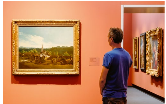
Blick in die Altmeister-Sammlung