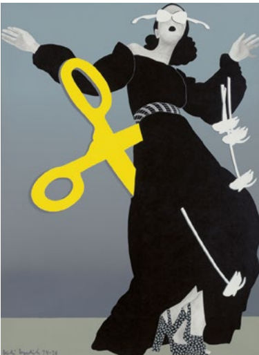
Kiki Kogelnik, Superserpent, 1974 Museum Ortnor, Wien, © 1974 Kiki Kogelnik Foundation. All rights reserved

Eine Ausstellung in Kooperation mit dem Kunstforum Wien.