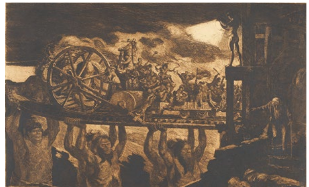
Albert Welti, Die Fahrt ins zwanzigste Jahrhundert, 1899 Kunsthaus Zürich

Das grafische Werk von Welti, der immer wieder den Bezug zur älteren Kunst suchte, wird mit dieser Ausstellung in das grössere Panorama fantastischer Kunst in der Zeit um 1750 bis 1900 eingeordnet.