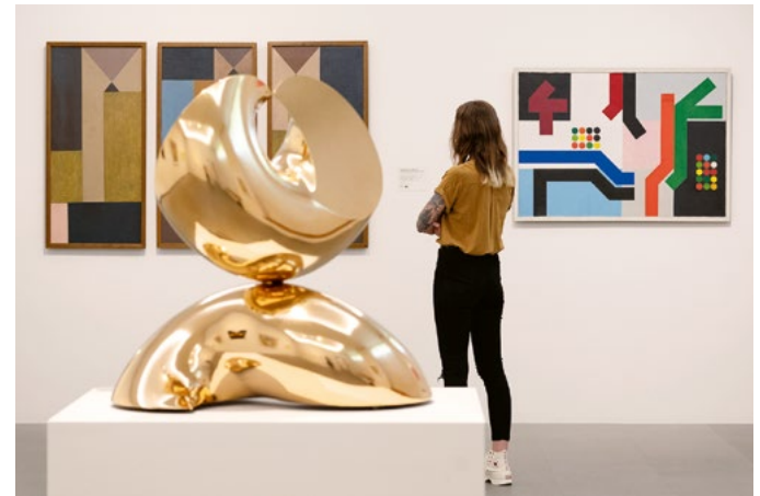
Schweizer Kunst. Max Bill (vorne)

dabei auf jene internationaler Künstlerinnen und Künstler, die er prägte oder die in Paris seine Zeitgenossen waren, darunter die Surrealisten (unter ihnen Meret Oppenheim), die Vertreterinnen und Vertreter der École de Paris, Francis Bacon und Rebecca Warren.