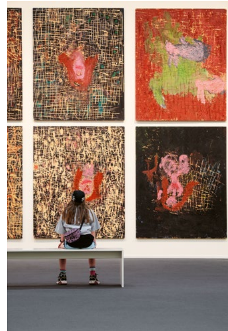
Georg Baselitz, 45, 1989 (Detail)