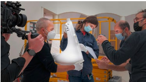
Barbara Visser, Alreadymade, 2023

8.3. – 30.6.24 Pfister-Bau, grosser Ausstellungssaal