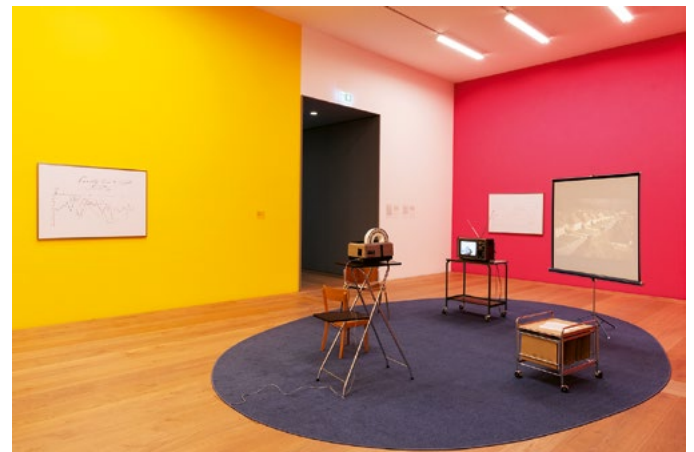
Digilab: James Bridle, The Distractor, 2023, © James Bridle

Computertechnologie prägt heute jeden Lebensbereich, entsprechend ist die digitale Transformation eine der spannendsten Herausforderungen unserer Zeit. Das Kunsthhaus Zürich hat daher →